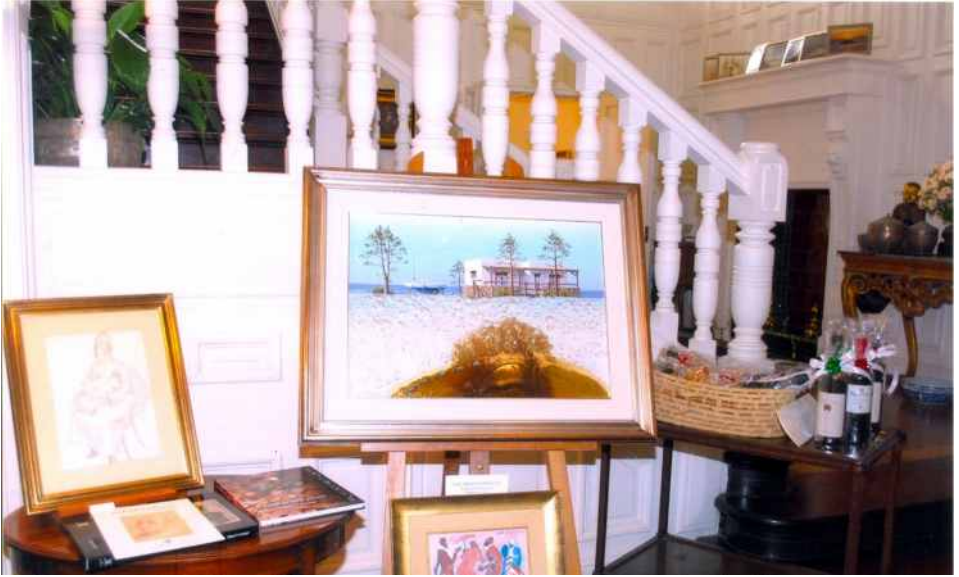
Cuadros donados para el remate para solventar nuestras obras