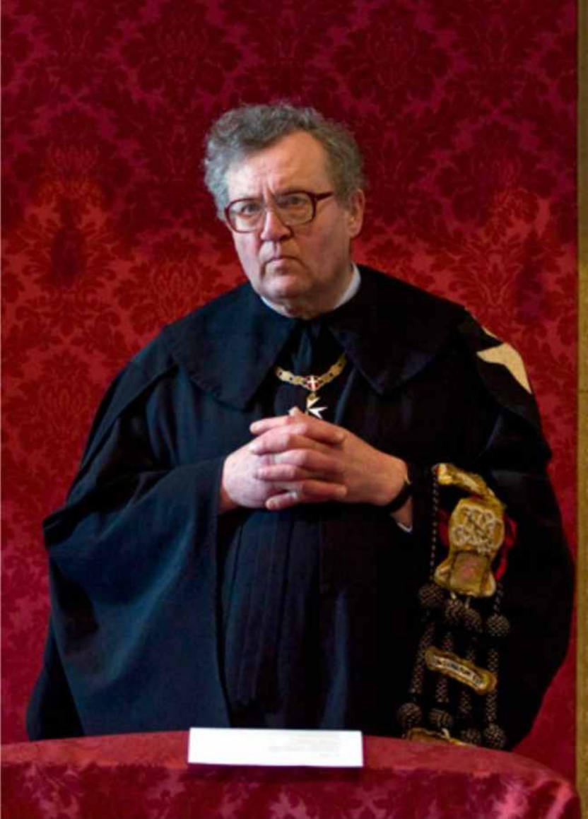
Su Alteza Eminentísima el Príncipe y Gran Maestro Frey Matthew FESTING