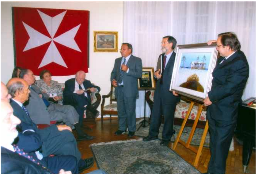
Remate de obra de arte